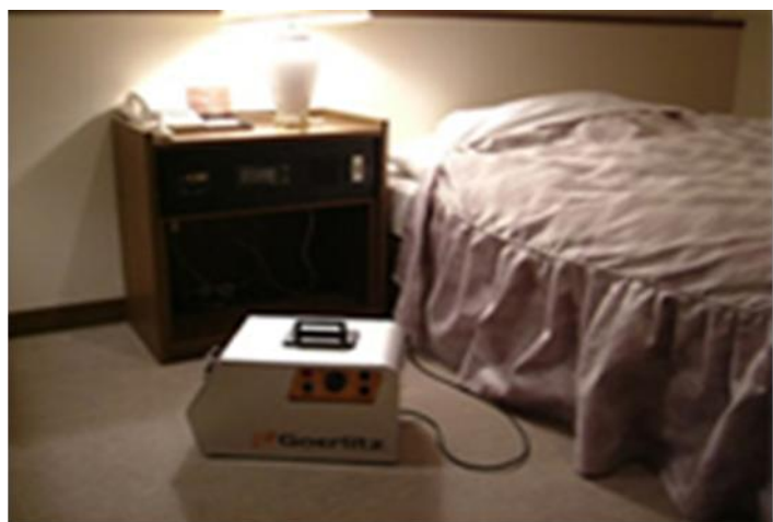
【脱臭機を使用し臭いを除去】