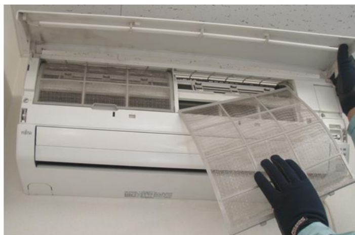
【エアコンをオーバーホールし臭いを除去】